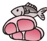
●ヘム鉄 (肉、魚、レバーなど)

鉄分は血液を作るうえで必要となり、成長期には欠かせない栄養素です。鉄分が不足すると「疲れやすい」「息切れする」などの症状が現れます。鉄分は「ヘム鉄」と「非ヘム鉄」に分類できます。体内で吸収されにくい非ヘム鉄は、ビタミンCといっしょに摂取すると吸収力がアップします。ヘム鉄と非ヘム鉄とをバランスよく摂取するようにしましょう。