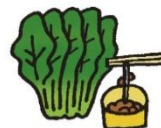
●非ヘム鉄 (ほうレンそう、小松菜、納豆など)